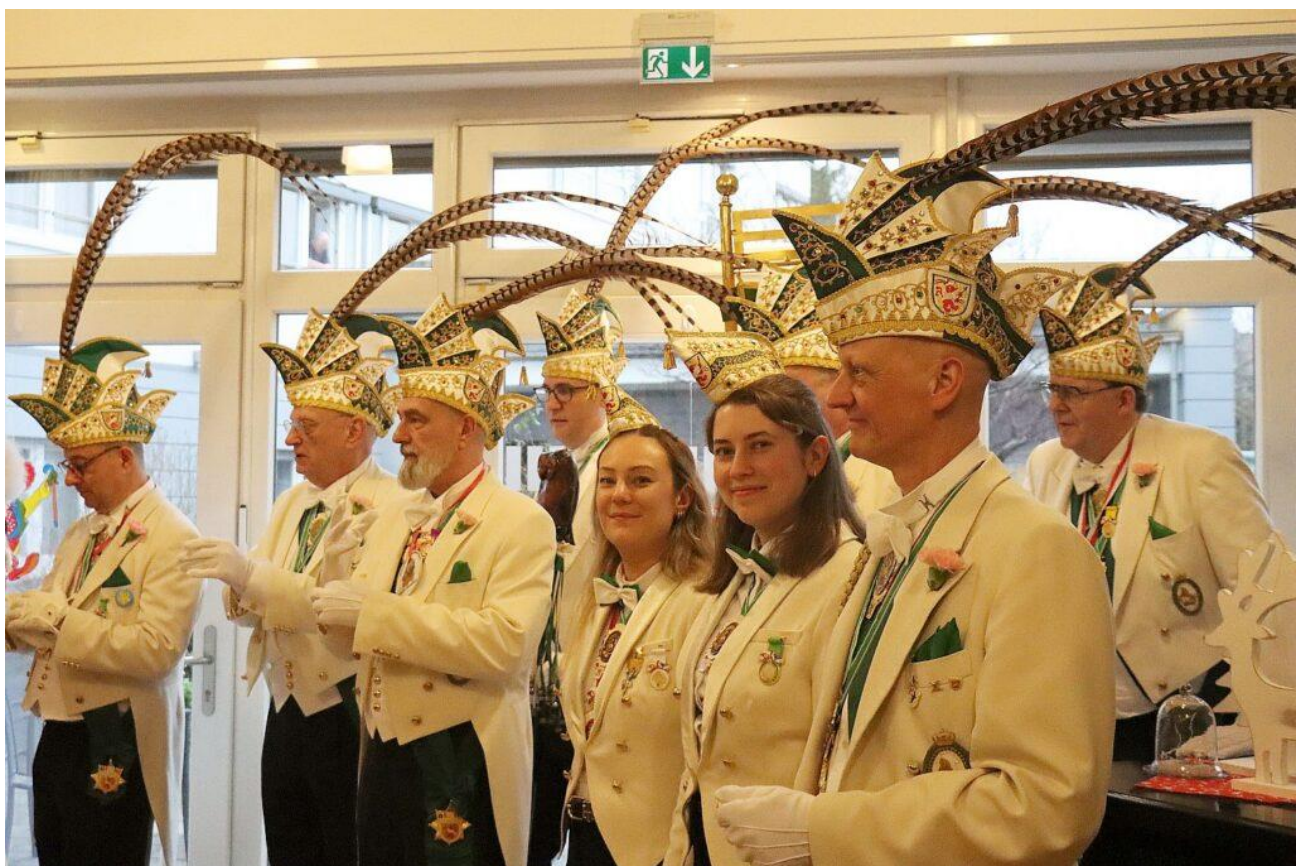
Die Weissfräcke und ihre Paginnen trugen ihre Fracks und die Kappen mit Fasanenfedern

Erstes Ziel waren die Caritas-Hausgemeinschaften St. Benediktus auf der Niederdonker Straße in Lörick.