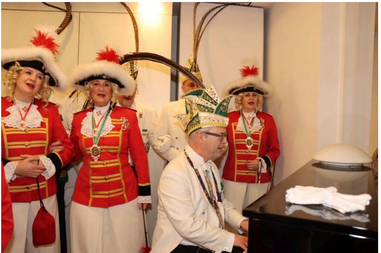
Der Präsident am Klavier

Auch waren die Düsseldorfer Originale dabei und alle gemeinsam freuten sich über die glücklichen Gesichter der Besuchten, die nun auf Karneval eingestimmt sind.