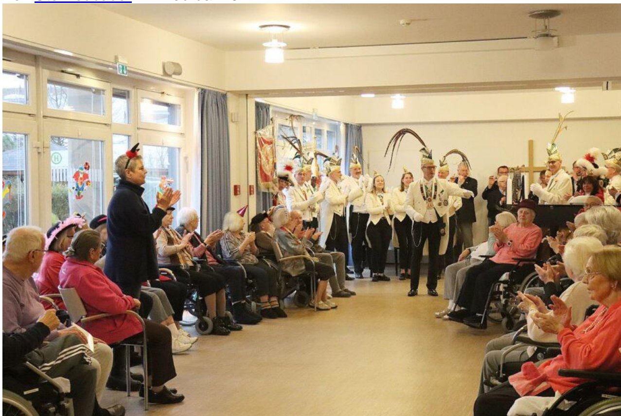
Eine Station war das Kronenhaus am Südring

Traditionell machen die Mitglieder der DKG Weissfräcke vor Karneval eine Besuchstour durch verschiedene Seniorenheime, um den Bewohner*innen eine Freude zu bereiten. So stand am Samstagtag (3.2.) ein großer Rheinbahnbus bereit, denn nicht nur die Weissfräcke fuhren mit, auch eine Abordnung der Amazonas und das Tambourcorps Rheinklänge Lohausen begleiteten die Karnevalisten.