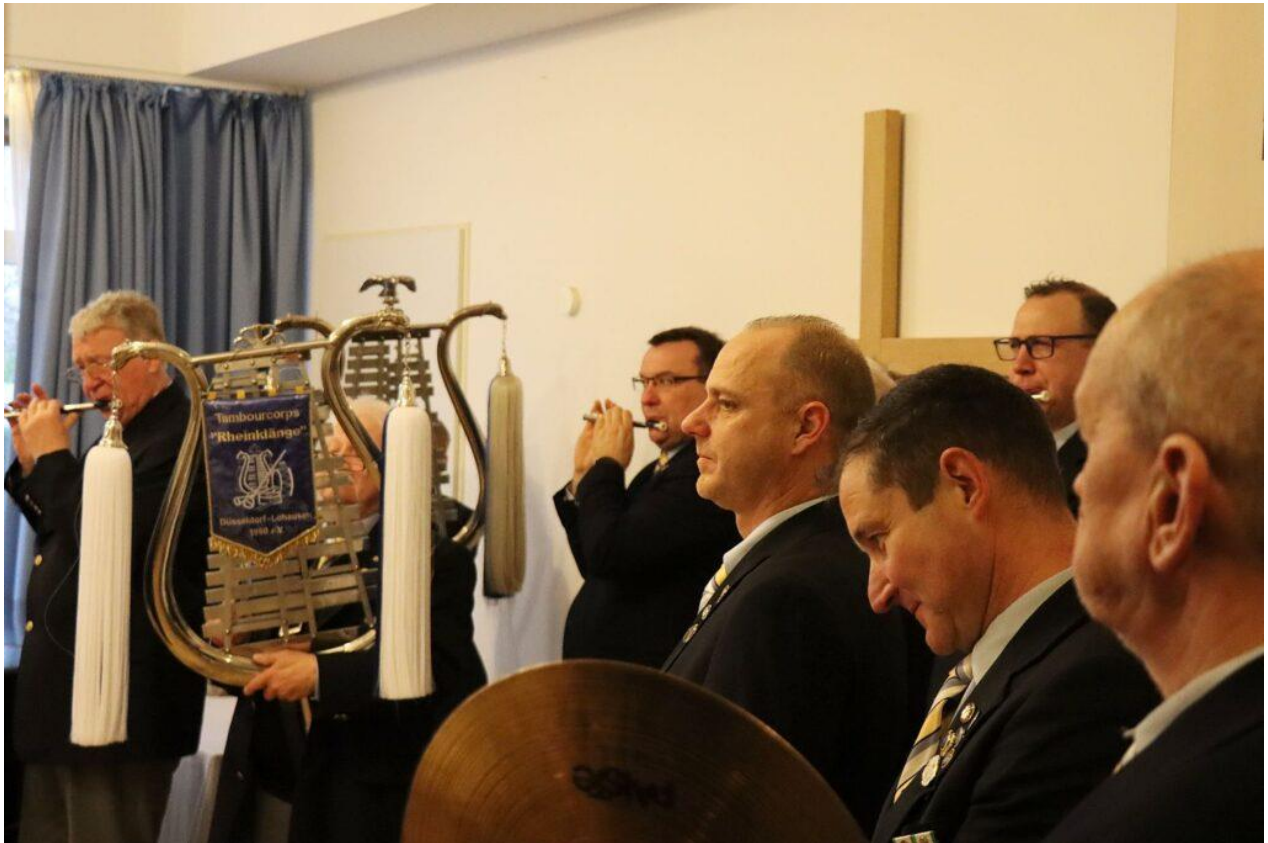
Die Musiker des Tambourcorps Rheinklänge Lohausen begleiteten die Tour

Von dort ging es wenige Meter weiter zum Lebenshilfe Haus Walther-Hensel-Straße. Mit musikalischer Unterstützung des Tambourcorps wurden gemeinsam Lieder gesungen, Orden verteilt und natürlich „Helau“ gerufen.