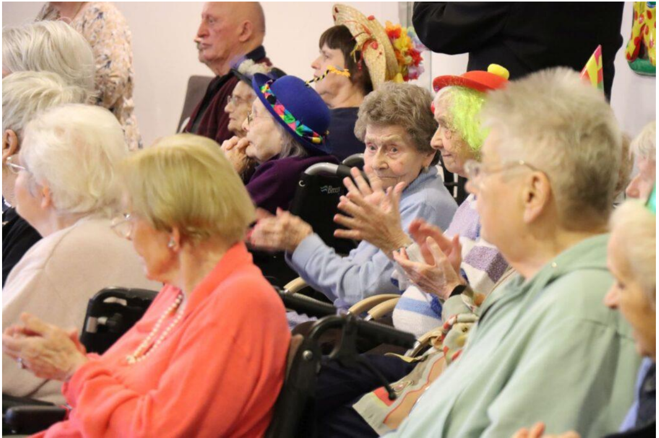
Die Senior*innen freuten sich über den Besuch

Venetia Leonie waren mit ihrer Adjutantur beim Besuch dabei. Rund 60 Senior*innen hatten sich im großen Saal im Erdgeschoss eingefunden und freuten sich über das karnevalistische Programm.